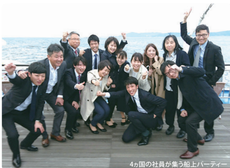
4か国の社員が集う船上パーティー